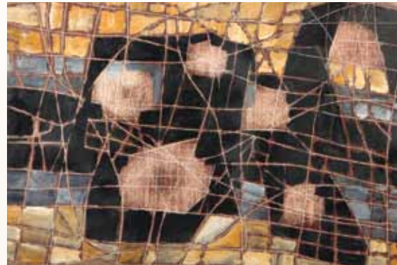
Composition, huile sur toile