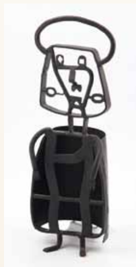
Saint Martin, métal