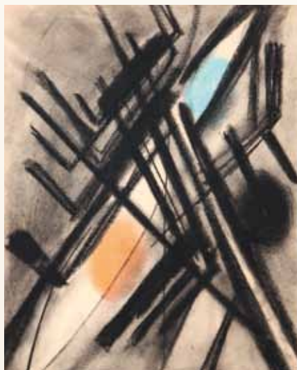
Sans titre, pastel