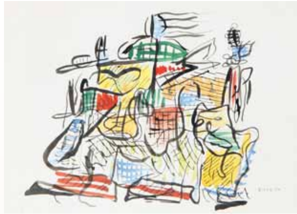
Sans titre, aquarelle