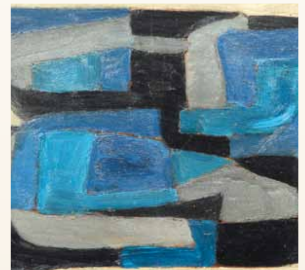
Sans titre, huile sur toile