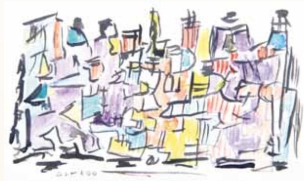
Sans titre, aquarelle