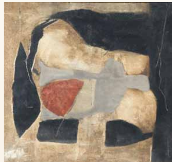
Sans titre, huile sur toile