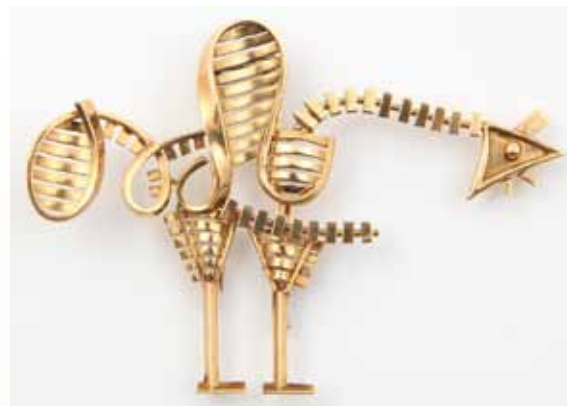
Broche oiseau réalisée par Mauboussin d'après une composition de J. Duthoo, or