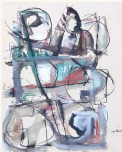
Sans titre, encre et gouache