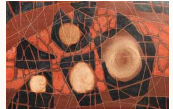
Composition, huile sur toile