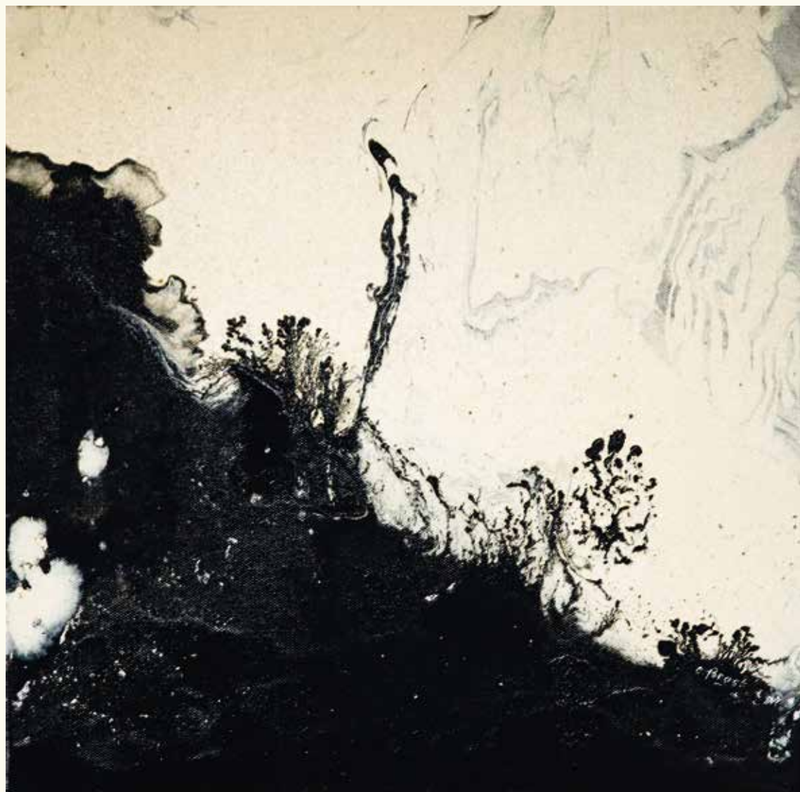
14.01.09 - Huile sur toile 30 x 30 cm

« À la nécessité intérieure de l'expression créatrice répond cette intention de partager des expériences sensibles. Figuration, abstraction, peu importe l'écriture, l'Art ouvre la porte du Sensible.