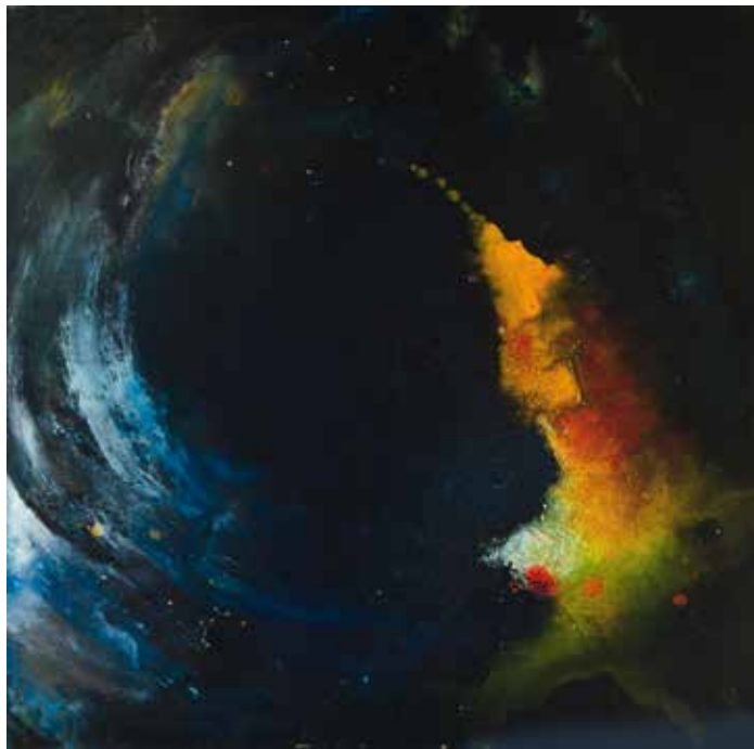
12.07.29 - 80 x 80 cm - Technique mixte