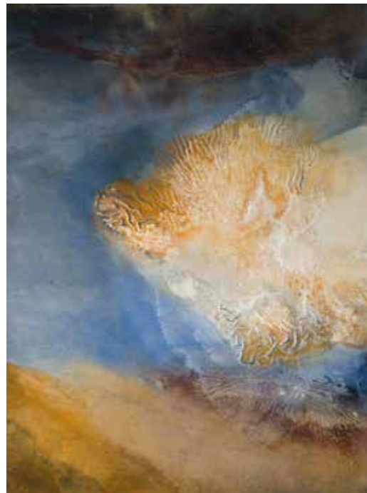
14.10.24 - Huile sur toile 80 x 60 cm