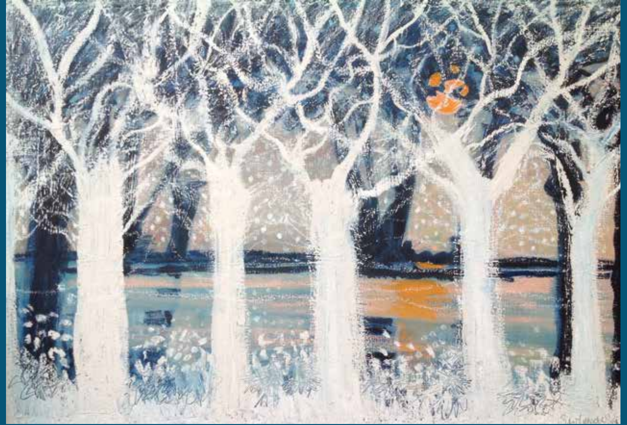
Sunbeam II - 69 x 100 cm - Huile sur toile