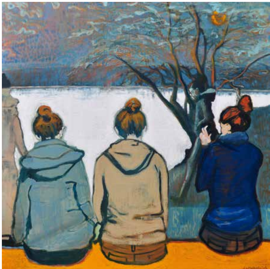
L'Espace du temps VIII - 100 x 100 cm - Huile sur toile