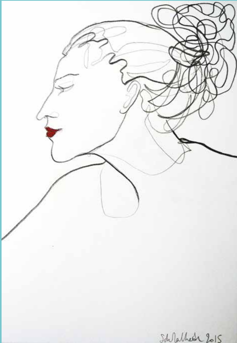
Stéphane Malherbe 2015 Rouge dessin IV - Crayon et gouache sur papier

1966 Née à Paris 1985-1990 ESAG Penninghen Ecole Supérieure d'Art graphique 1990-1992 Travaille comme graphiste chez Jean-Paul Gaultier 1994 Première exposition individuelle à Paris. Elle part vivre au Mexique. Elle y restera 11 ans puis 5 ans à Séville puis Madrid. 2010 Retour en France. 1994-2015 Expositions individuelles et collectives en France, au Mexique, en Espagne, en Belgique et en Suisse. Plus de 150 commandes de portraits. 2015 - Exposition du 4 septembre au 22 novembre 2015 au Château de Tours.