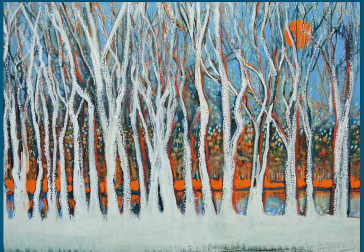
Spring after winter - 100 x 70 cm - Huile sur toile