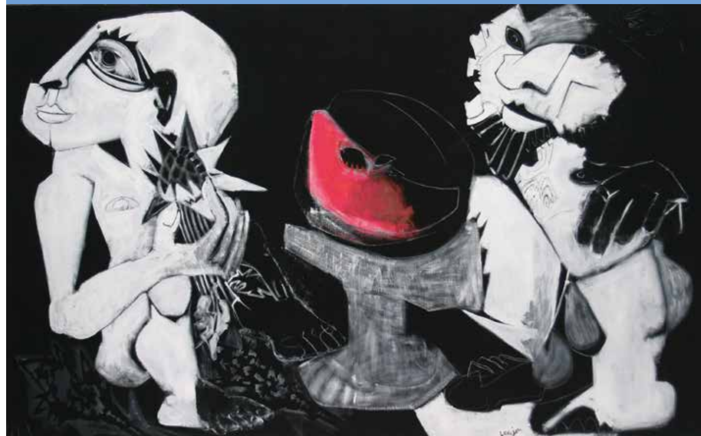
Berger volage - 1971 Acrylique sur toile - 150 cm x 250 cm Collection privée