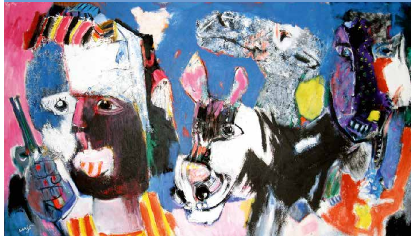
Afghanistan - 1980 Huile sur toile - 150 cm x 250 cm Collection privée