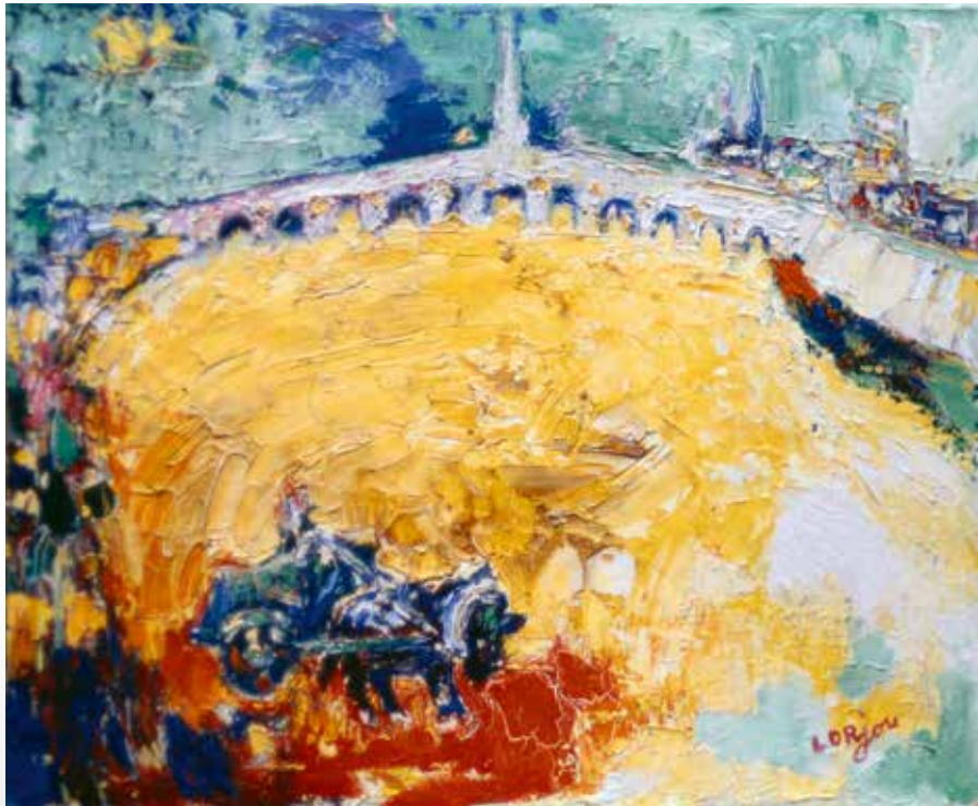
Le Pont de Blois jaune - 1966 Huile sur toile - 60 cm x 73 cm Collection privée

Exposition présentée au Château de Tours du 2 décembre 2016 au 12 février 2017, réalisée en partenariat avec L'Association Bernard Lorjou - 7, rue Bellevue - 41000 Saint-Denis-sur-Loire - France - asso.lorjou@orange.fr