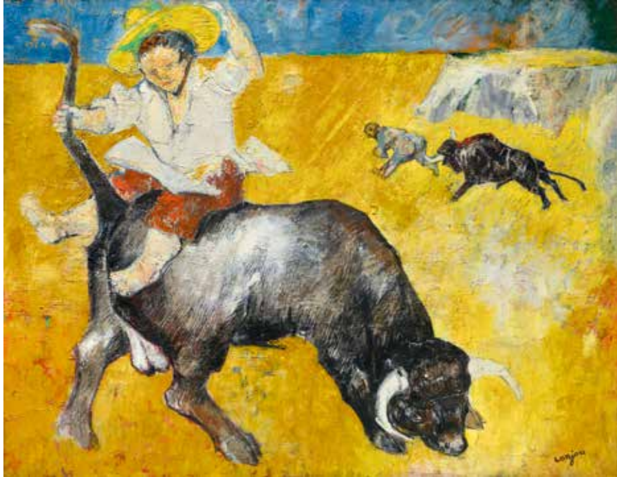
Plaisir de Campagne espagnole - 1954 Huile sur toile - 114 cm x 146 cm Collection privée