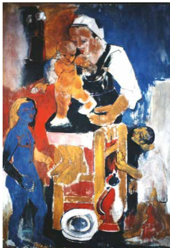
La Naissance du Peintre - 1948 Huile sur toile - 198 cm x 136 cm Collection privée

Présidente de l'Association Bernard Lorjou