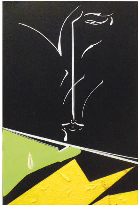
Citron vert 41 x 27