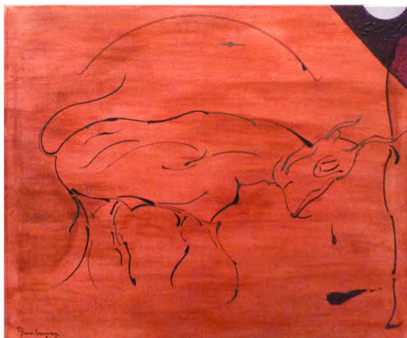
Taureau rouge 50 x 60