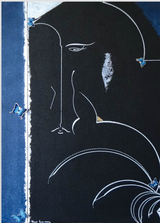
Psyché papillons bleus 90 x 60

Exposition présentée au Château de Tours du 29 avril au 24 juillet 2016