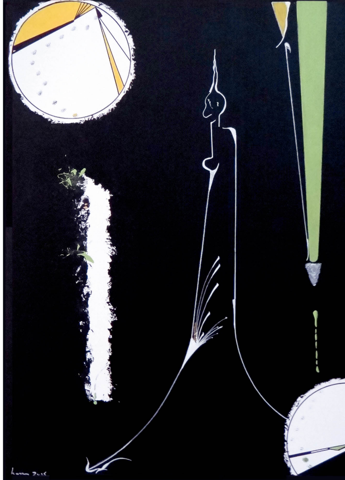
Sablier 80 x 60