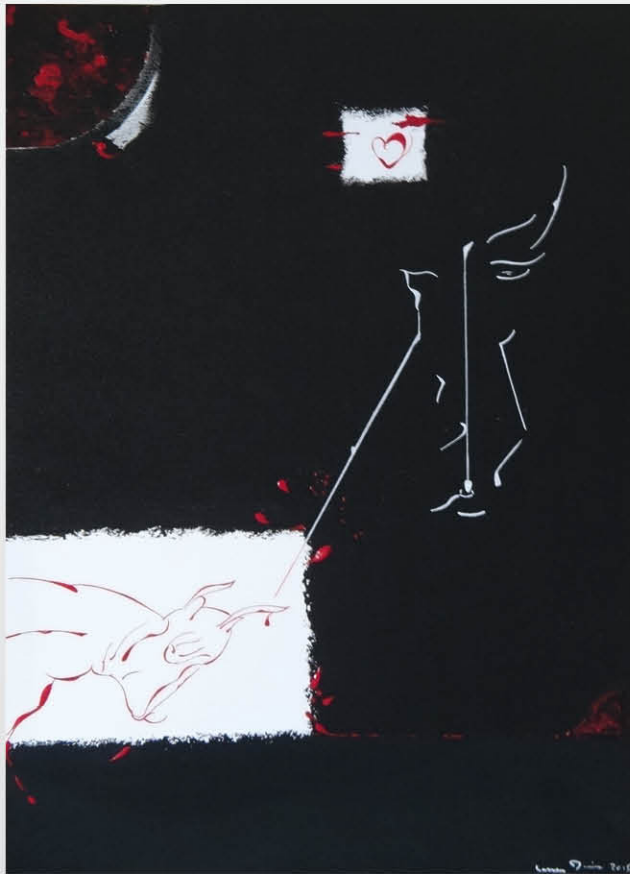
Toro taureau 90 x 60