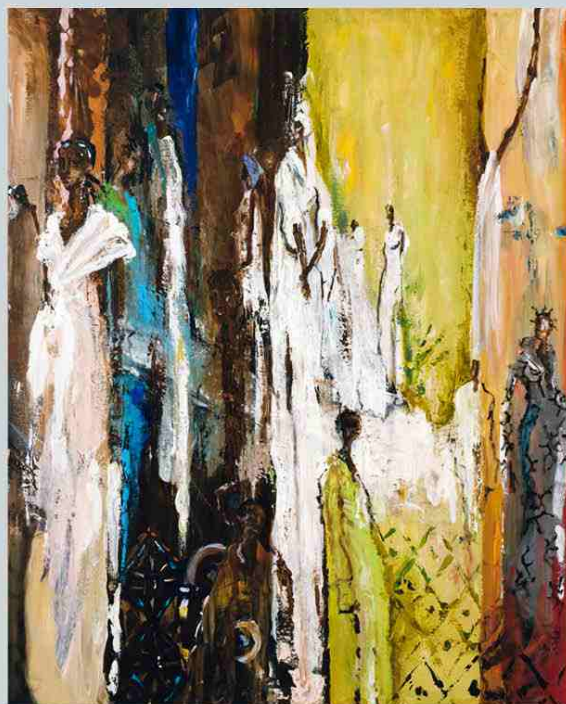
Celles qui attendent - 100 x 81 cm - Acrylique sur toile

Exposition présentée au Château de Tours du 24 février au 7 mai 2017