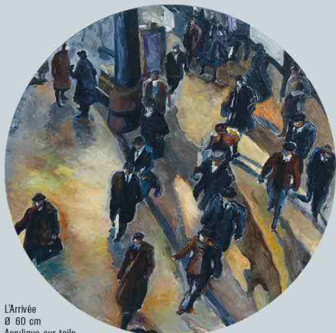
L'Arrivée Ø 60 cm Acrylique sur toile